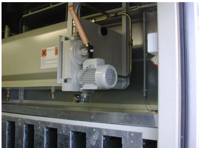
Detaillösung Kraftstoff-Tagesbehälter mit Auffangwanne und Pumpenkombination